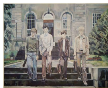
高松明日香《月曜のテレパシー》2013年 アクリル・カンヴァス 130.3×162.0cm