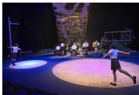
【平成26年8月 初演時の「わたしの星」舞台写真】

劇団「ままごと」を率いる作・演出家の柴幸男は、平成21年10月に星のホールで上演した「わが星」で第54回岸田戯曲賞を受賞するなど、今、若手で最も注目を浴びている作家の一人です。その柴幸男の作・演出により、平成26年8月に星のホールで上演された「わたしの星」は、「わが星」の世界観を受け継いだ姉妹版として作られたオリジナル作品であり、CASTとしてオーディションに合格した10人の高校生だけが出演し、STAFFも、プロの指導の下、高校生5人が可能な限り関わっていく公演として実施し、内外から数多くの賞賛の声が寄せられました。