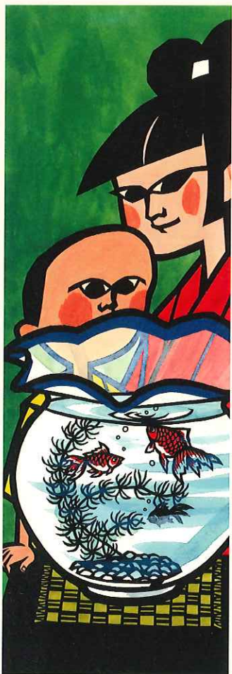
《金魚》1971年 きりえ/和紙・洋紙、墨・水彩 41.5×14.2cm 朝日新聞日曜版掲載

本展では、2009(平成21)年に亡くなった滝平二郎の画業を振り返り、知られざる初期の木版画から「きりえ」へと移行した中期の絵本原画、人気を博した新聞連載の原画まで、その詩情あふれる作品群を紹介します。