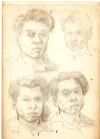
《自画像(4つの自画像)》1952年 紙、鉛筆 28.6×20.6cm