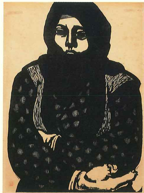
《霞ヶ浦にて》1955年 木版/和紙、油性墨一色摺り 45.5×35.0cm

滝平二郎(たきだいら・じろう)は、1921(大正10)年茨城県新治郡玉川村(現・小美玉市)の裕福な農家の次男として生まれました。子どもの頃から絵本や講談本に親しみ、高校時代は漫画サークルに加入し風刺漫画の制作に傾倒します。卒業後は独学で木版画を習得し、身近な農村の日常を題材にした作品を制作し展覧会へ出品するなど画家を志します。徴兵により一時中断を余儀なくされますが、終戦の後に自然とともに生きる人々の姿や自身の戦争体験を題材とした作品を発表し、木版画家としての地位を確立します。