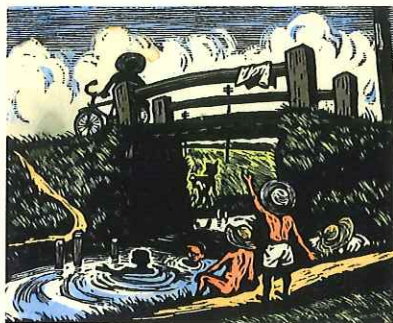
《土橋》1951年 木版/和紙、油性多色摺り(合羽摺り) 18.9×23.0cm