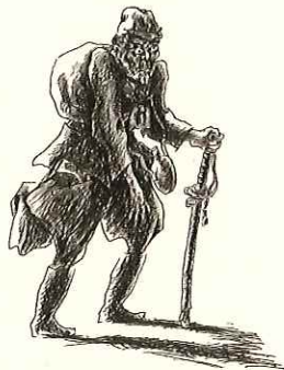
《戦争敗走記/部隊長》 1947年 紙、ペン(インク) 36.0×25.7cm