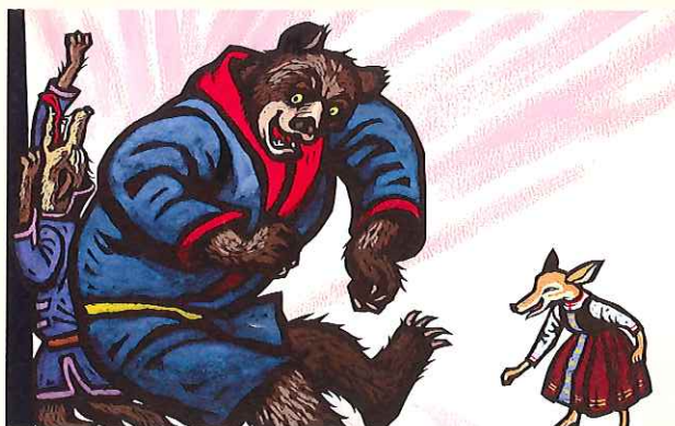
《ちいさいおしろ》1968年 きりえ/和紙・洋紙、墨・グアッシュ 23.0×37.0cm