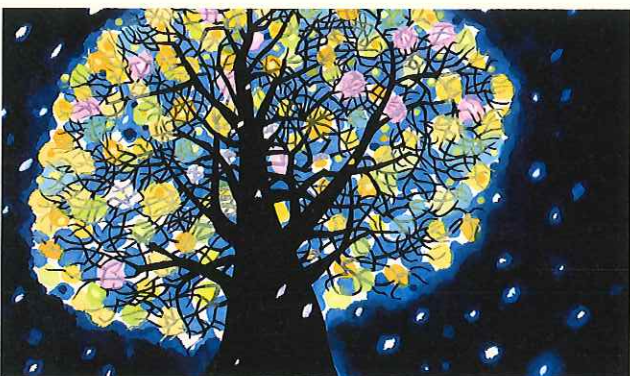
《モチモチの木》1971年 きりえ/和紙・洋紙、墨・水彩 28.5×48.5cm