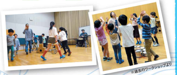
※過去のワークショップより