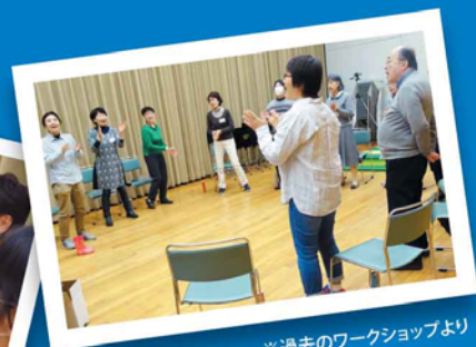
※過去のワークショップより