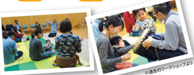
※過去のワークショップより