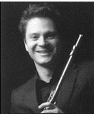
カール=ハインツ・シュッツ フルート Karl-Heinz Schütz flute

オーストリアのインスブルック生まれ。ウィーン国立歌劇場管およびウィーン・フィルの首席フルート奏者。ウィーン・コンセルヴァトリウム音楽大学のフルート科教授を務める。シュトゥットガルト・フィル、ウィーン響の首席フルート奏者を歴任。客演奏者として、またソリストとして世界の名だたるオーケストラと共演し、室内楽奏者としても活躍している。札幌のパンフィック・ミュージック・フェスティバル(PMF)にも教授陣として招聘されている。レパートリーは古典作品から前衛作品まで広範囲に及ぶ。CDはプロコフィエフ:フルート・ソナタ、ブラームス:フルート・ソナタ、20世紀の合奏協奏曲集、ドブナー:フルート作品集等をリリースしている。