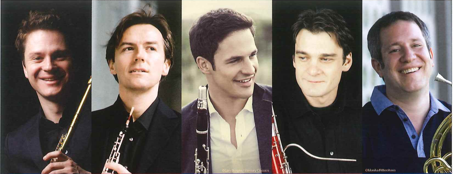
カール＝ハインツ・シュッツ フルート Karl-Heinz Schütz flute