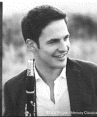
アンドレアス・オッテンザマー クラリネット Andreas Ottensamer clarinet

イギリスのピーターズフィールド生まれ。ケンブリッジ大学で歴史学を学び、ロンドンの王立アカデミーとパリ国立高等音楽院でオーボエを学ぶ。1993年、バーミンガム市交響楽団の首席オーボエ奏者に就任。バーミンガム・コンテンポラリー・ミュージック・グループのメンバーとして、また、ヨーロッパ室内管弦楽団のレギュラーメンバーとしても活躍。2003年、ベルリン・フィル首席オーボエ奏者に就任し、ソリストとして定期的にベルリン・パロック・ソリストと共演を続け、CDの録音も積極的に行っている。また、シャルーン・アンサンブル・ベルリンとも頻りに共演。ツェムリンスキーの演奏者としてだけでなく、講師として教育活動にも参加している。