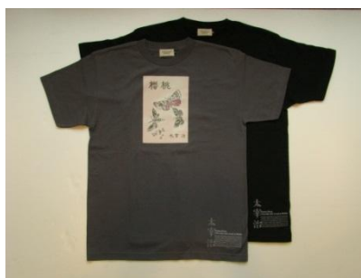
【図録・書籍や財団オリジナル商品の販売を行ないます】

友の会 MARCL の会報誌として年6回発行します。主催事業を網羅した冊子で、出演者のインタビューも取り入れ魅力的な紙面を目指します。