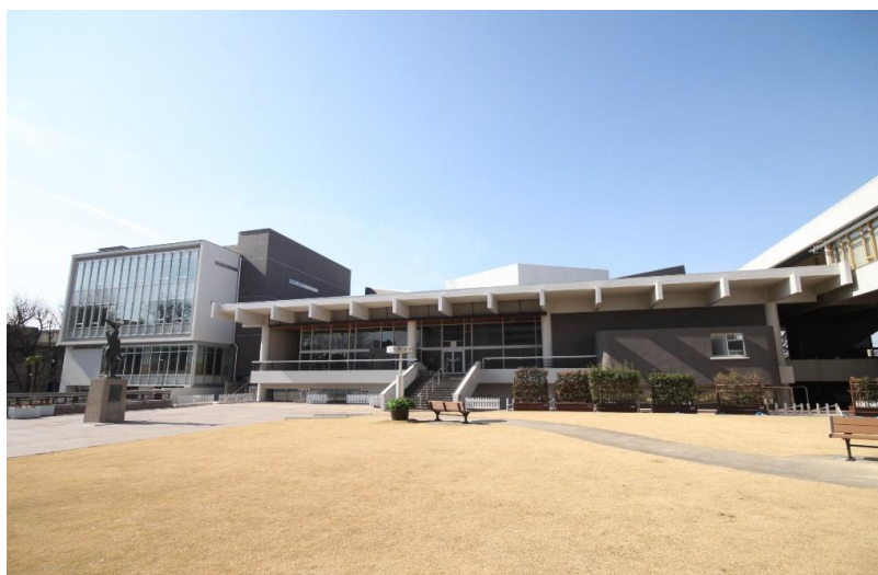
三鷹市公会堂 東側外観