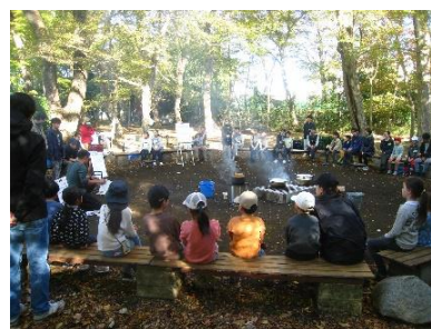
親子野外キャンプ教室

屋外での活動を通じて友だちとの遊びからコミュニケーション能力を育み、体を動かすことの楽しさを体験してもらうことを目的としたキャンプ教室を開催します。 1回