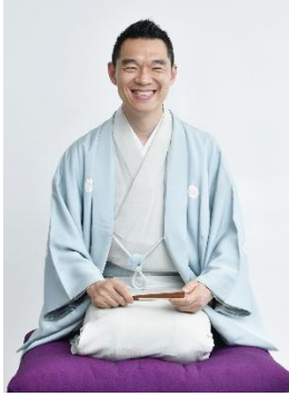
柳家花緑 (C)馬場道浩