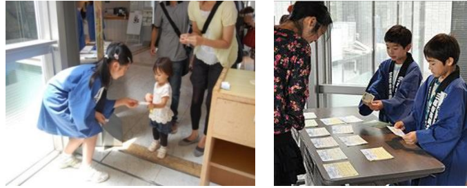
過去のお客様係体験講座風景