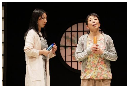
12公演『あたしは葉桜』2023年4月／星のホール

見事な会話劇で観客を魅了する「iaku」。誰もが一生懸命生きているのだが、ほんの瞬間の心の弱さゆえに、家族や友人、恋人同士の間を生じてしまった僅かな溝。その小さな溝を、人はどう見つめ、どう繕っていくのか。年配の方から若者まで、全ての世代の心に訴えかける、見応えのある人間ドラマです。 12公演