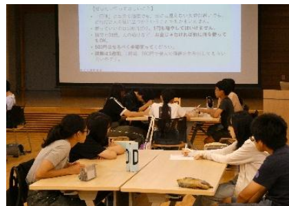
「ジュニアキャンパス プレゼンの達人」