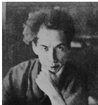
芥川龍之介