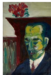
【太宰治《鯨崎潤》】 制作 昭和14、15年頃 (鯨崎家寄託)

休室日: 9月 1、8～12、16～19、22、29日 10月 6、14、15、20、21、27日