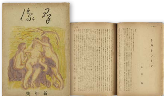
「群像」昭和22年1月 大日本雄弁会講談社 (公財)三鷹市スポーツと文化財団蔵 (「トカトントン」初出誌)