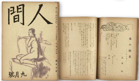
「人間」昭和21年9月 鎌倉文庫 (公財)三鷹市スポーツと文化財団蔵 (「春の枯葉」初出誌)