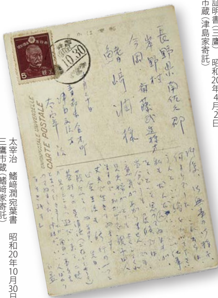
太宰治 鮎崎潤宛葉書 昭和20年10月30日 三鷹市蔵(鮎崎家寄託)