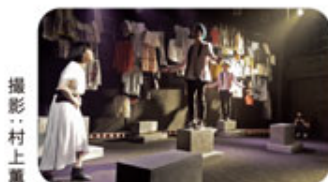
『預言者Q太郎の一生』(2017)