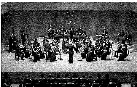
OLC第39回定期演奏会 三鷹市芸術文化センター(2017.6.24)