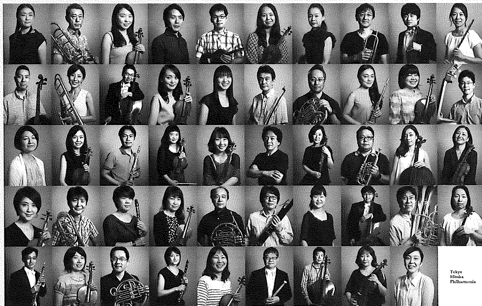
第73回定期演奏会(2016年7月30日)出演メンバーより

トウキョウ・ミタカ・フィルハーモニア第77回定期演奏会は、音楽監督の沼尻竜典のピアノ弾き振りによるモーツァルトのピアノ協奏曲第19番、ブラームスの交響曲第4番、3月(第76回定期)に好評を博したK.136のディヴェルティメントに続き、同じく名作のK.137をお贈りします。