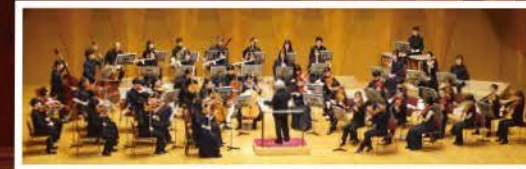
みたかジュニア・オーケストラ (管弦楽)