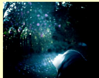
齋藤陽道 《すべての別離はさりげない》 2022年撮影

作品は私たちにどのような記憶や感情を呼び起こすのでしょうか。ぜひゆっくりと語り合い、作品の中にひそむ物語のかけらを見つけに来てください。