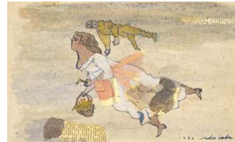
野田英夫《籠を持てる少女》1932年 / 紙・インク、水彩、コラージュ