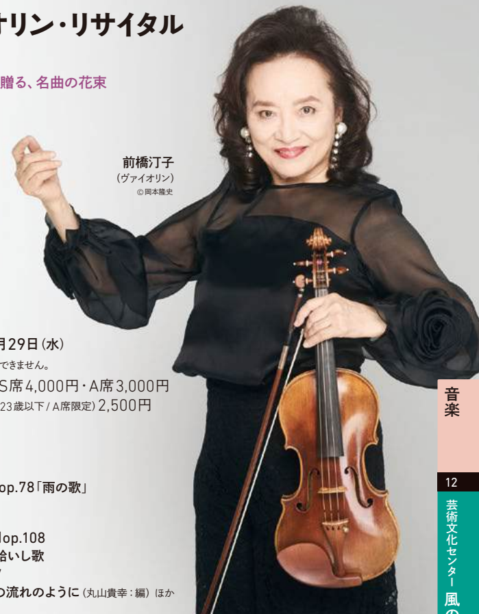
前橋汀子 (ヴァイオリン)

長年にわたり日本のヴァイオリン界をリードする、前橋汀子の演奏に、どうぞご期待ください。