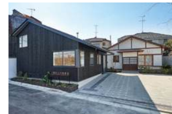
三鷹市吉村昭書斎 外観

往信はがきに、①参加者氏名、②住所・電話番号を、返信はがきに宛先をご記入ください。