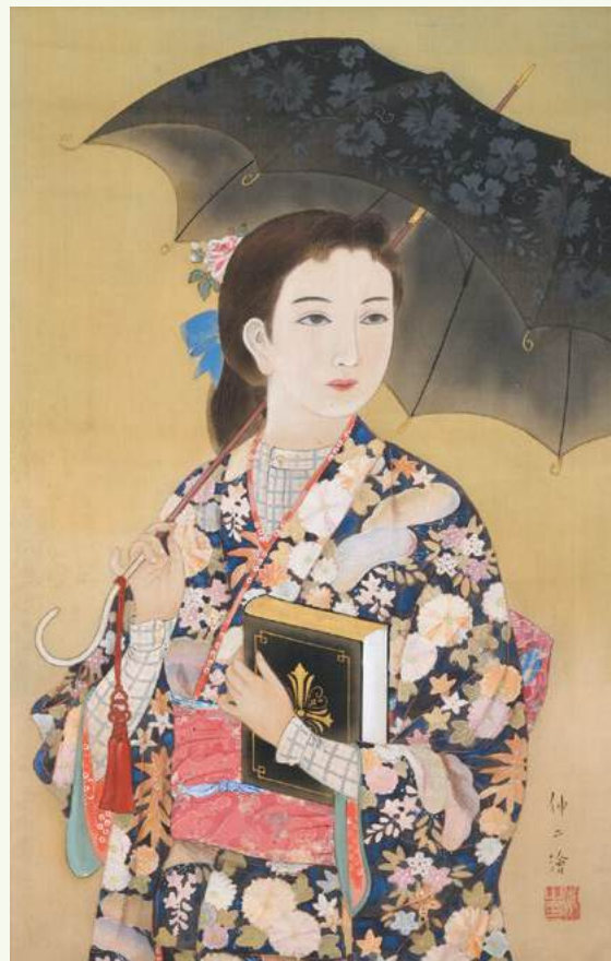
粥川伸二「娘」1928年 / 絹本彩色

発掘された珠玉の名品 少女たち —夢と希望・そのはざま— 星野画廊コレクションより