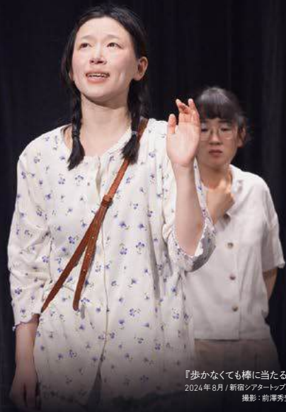
『歩かなくても棒に当たる』 2024年8月 / 新宿シアタートップス