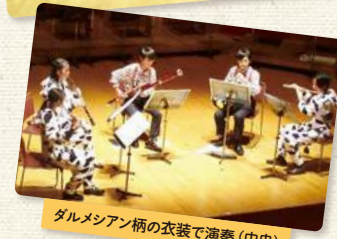
ダルメシアン柄の衣装で演奏(中央)