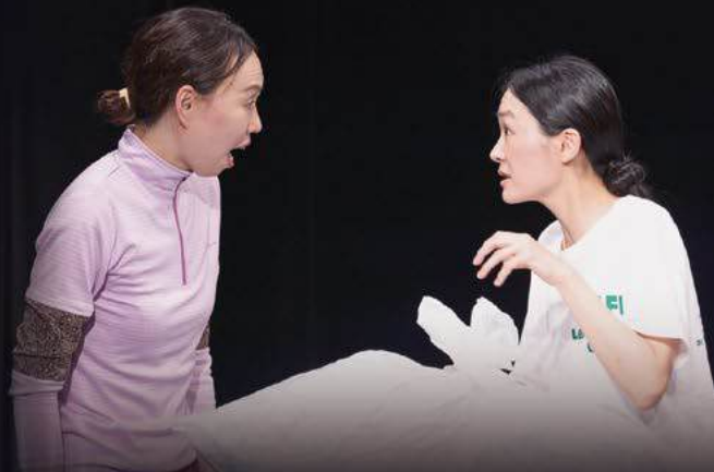
『歩かなくても棒に当たる』 2024年8月 / 新宿シアタートップス