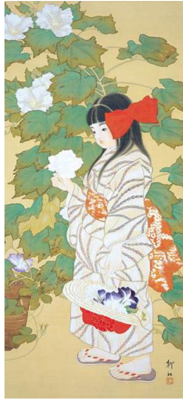
作者不詳《夏苑の少女》1912-1926年 / 絹本彩色