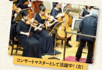
コンサートマスターとして活躍中！(左)