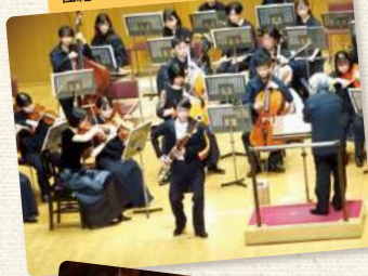
在籍中はソリストとして活躍しました