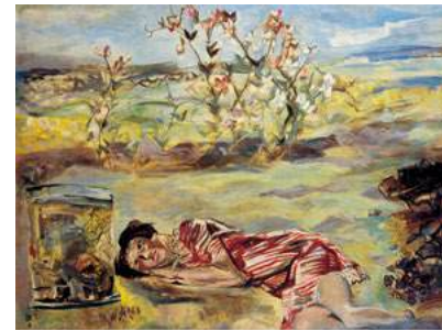
松村綾子《少女・金魚鉢》1937年 / キャンバス・油彩