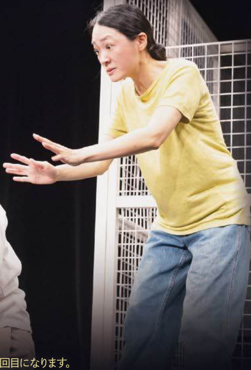
『歩かなくても棒に当たる』 2024年8月 / 新宿シアタートップス

全席自由 (日時指定・整理番号付き) 託児あり *4/19(土) 14:00の回のみ 【会員】 前売3,000円・当日3,500円 【一般】 前売3,500円・当日4,000円 【U-25】 前売・当日とも3,000円(当日身分証拝見) 【高校生以下】 前売・当日とも1,000円(当日学生証拝見) ★早期公演割引は、すべて300円引き *未就学児は入場できません。 *「U-25」および「高校生以下」は、いずれも公演日時点