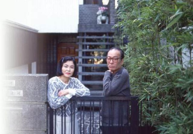
三鷹の自宅の門扉にて