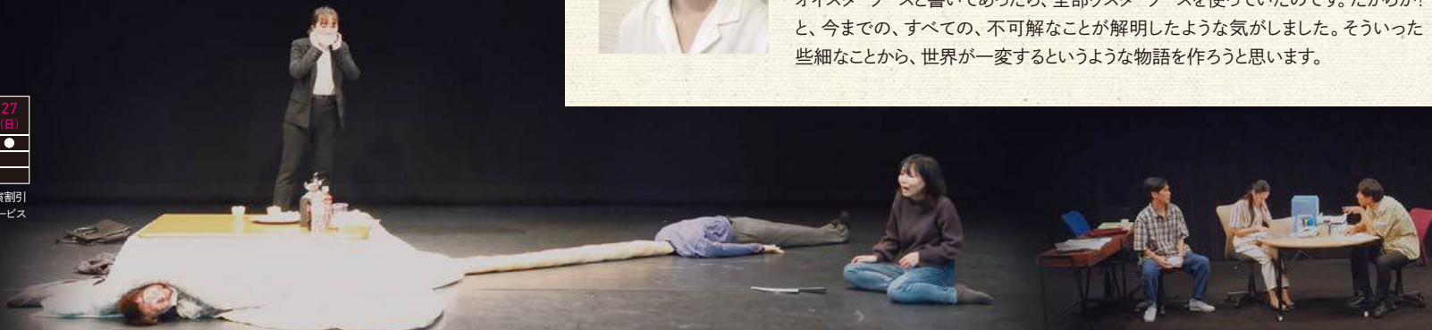
かながわ短編演劇アワード『それどころじゃない』 2021年3月 / KAAAT 神奈川芸術劇場 大スタジオ

私は今日、ウスターソースとオイスターソースが別物だということを初めて知りました。 そのことは本当に私を驚かせました。ウスターソースはオイスターソースが訛ったもの だと思っていたのです。訛ったか、もしくは、オイスターソースという名称を誰かが特許 取ってしまったら使えなくなったから、仕方なくそれっぽいウスターソースと名乗って いるのだと思っていました。チュロスとチュリトスの違いみたいなことです。ティッシュと ティシューの違いみたいなことでもあります。なので、私は今まで、料理のレシピに オイスターソースと書いてあったら、全部ウスターソースを使っていたのです。だからか! と、今までの、すべての、不可解なことが解明したような気がしました。そういった 些細なことから、世界が一変するというような物語を作ろうと思います。