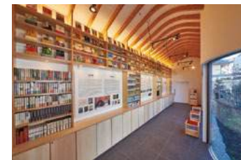
交流棟 内観